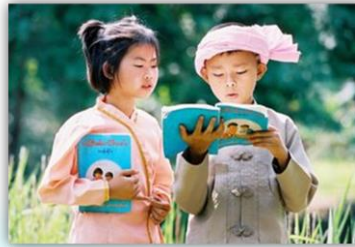
ชาวไทยใหญ่

1.) ชาวไทยใหญ่ หรือ ฉาน เป็นกลุ่มชาติพันธุ์ขนาดใหญ่ที่อาศัยอยู่ในพื้นที่จังหวัดแม่ฮ่องสอน มีภาษาเขียนและภาษาพูดเป็นของตนเอง