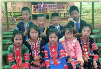
ชาวล่าหู่

2.) ชาวล่าหู่ หรือ มูเซอ เป็นชาวเขาเผ่าหนึ่งในประเทศไทย ซึ่งที่อาศัยอยู่ในพื้นที่ตำบลแม่नाเต็งส่วนใหญ่เป็น ชาวมูเซอแดง อาศัยอยู่แถบหมู่บ้านย้อมชายป่า หมู่ 3 หย่อมบ้านป่ายาง และหมู่ 4 หย่อมบ้านยะโป้