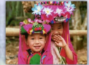
งานประเพณีกินวอ (ปีใหม่ลีซอ)

4.) คนเมือง หรือ ชาวล้านนา เป็นกลุ่มชนส่วนใหญ่ที่อาศัยอยู่ในหมู่บ้าน หมู่ 2 บ้านแม่नाเต็ง, หมู่ 6 บ้านนาจลอง และหมู่ 11 บ้านนาจลองใหม่ มีภาษาพูดและเขียนเป็นของตนเอง