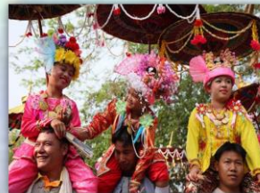
ประเพณีปอยส่างลอง