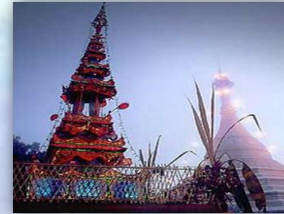
ประเพณีแห่จองพารา

2.) ชาวล่าหู่ หรือ มูเซอ เป็นชาวเขาเผ่าหนึ่งในประเทศไทย ซึ่งที่อาศัยอยู่ในพื้นที่ตำบลแม่नाเต็งส่วนใหญ่เป็น ชาวมูเซอแดง อาศัยอยู่แถบหมู่บ้านย้อมชายป่า หมู่ 3 หย่อมบ้านป่ายาง และหมู่ 4 หย่อมบ้านยะโป้