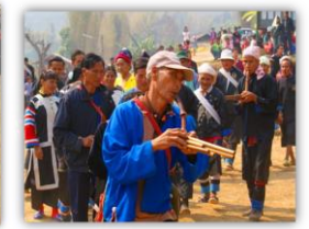
งานประเพณีกินวอ (ปีใหม่มูเซอ)

3.) ชาวลีซอ หรือ ลีซอ เป็นชาวเขาเผ่าหนึ่งที่อาศัยอยู่ในพื้นที่ตำบลแม่नाเต็ง อาศัยอยู่ใน หมู่ 7 บ้านปางแปก, หมู่ 9 บ้านดอยฝีลู่ และหมู่ 10 บ้านไทรงาม